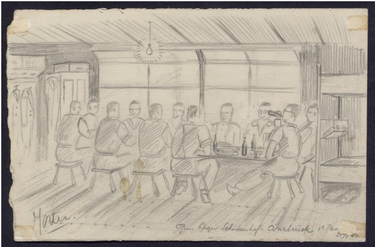
Schets gemaakt in Lager Schützenhof te Osnabrück 1 e paasdag d.d. 20-04-1943